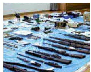
自動装填式拳銃銃身を摘発 し、その後の捜査でさらに大量 の銃器等を押収(国際郵便物)