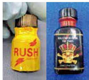
スーツケース内に隠匿されて いた指定薬物(旅客)