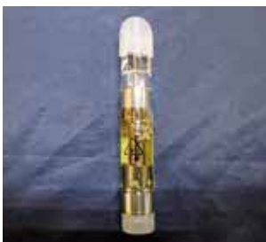
郵便物内に隠匿されていた大 麻製品(大麻リキッド)(国際郵 便物)