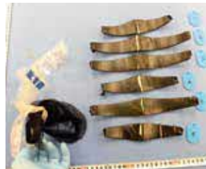
かつらの中に隠匿されていた 金地金(旅客)