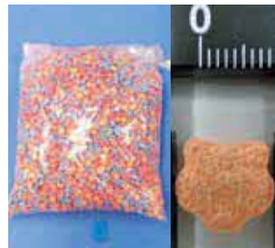
スーツケース内に隠匿されて いたMDMA(旅客)