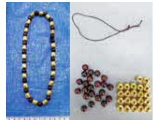
数珠に偽装されていた金地金 (航空貨物)