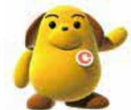
税関イメージキャラクター カスタム君

貿易の健全な発展と 安全な社会を実現す るため、世界最先端の 税関をめざします。