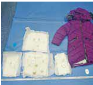
ダウンコート内に隠匿されて いたコカイン(旅客)