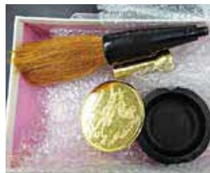
硯と筆に偽装工作されていた 金地金(航空貨物)