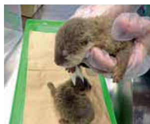
スーツケース内に隠匿されて いたコツメカワウソの赤ちゃん (旅客)