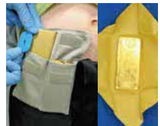
身辺に隠匿されていた金地金 (旅客)