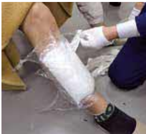
身辺に巻き付けて隠匿されて いた覚醒剤(旅客)